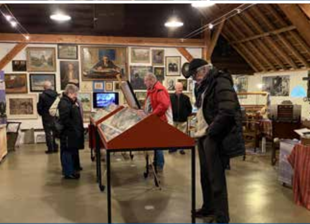
Ansichtkaartencollectie Ernst Wortel te kijk bij HKL