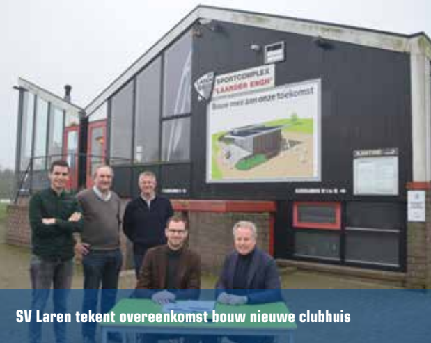
SV Laren tekent overeenkomst bouw nieuwe clubhuis