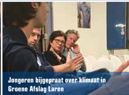
Jongeren bijgepraat over klimaat in Groene Afslag Laren