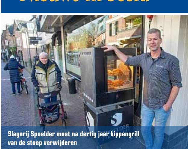
Slagerij Spoelder moet na dertig jaar kippengrill van de stoep verwijderen