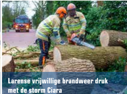
Larense vrijwillige brandweer druk met de storm Ciara