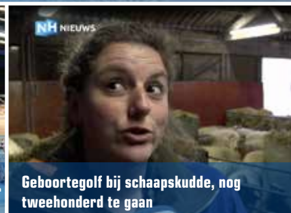
Geboortegolf bij schaapskudde, nog tweehonderd te gaan