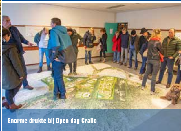
Enorme drukte bij Open dag Crailo