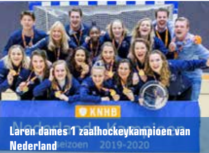
Laren dames 1 zaal hockeykampioen van Nederland seizoen 2019-2020