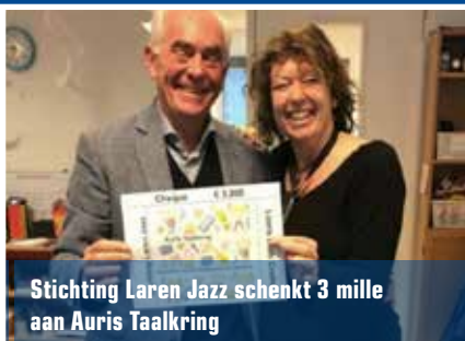
Stichting Laren Jazz schenkt 3 mille aan Auris Taalkring