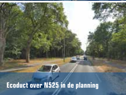
Ecoduct over N525 in de planning