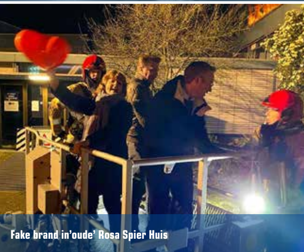
Fake brand in 'oude' Rosa Spier Huis